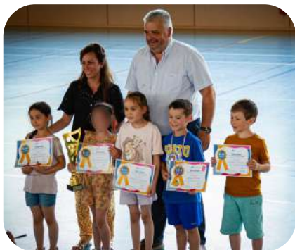
École de Manhecourt classe de CP

La municipalité a récompensé les cinq classes ayant obtenu le plus de points par un après-midi récréatif, avec une classe gagnante par niveau du CP au CM2.