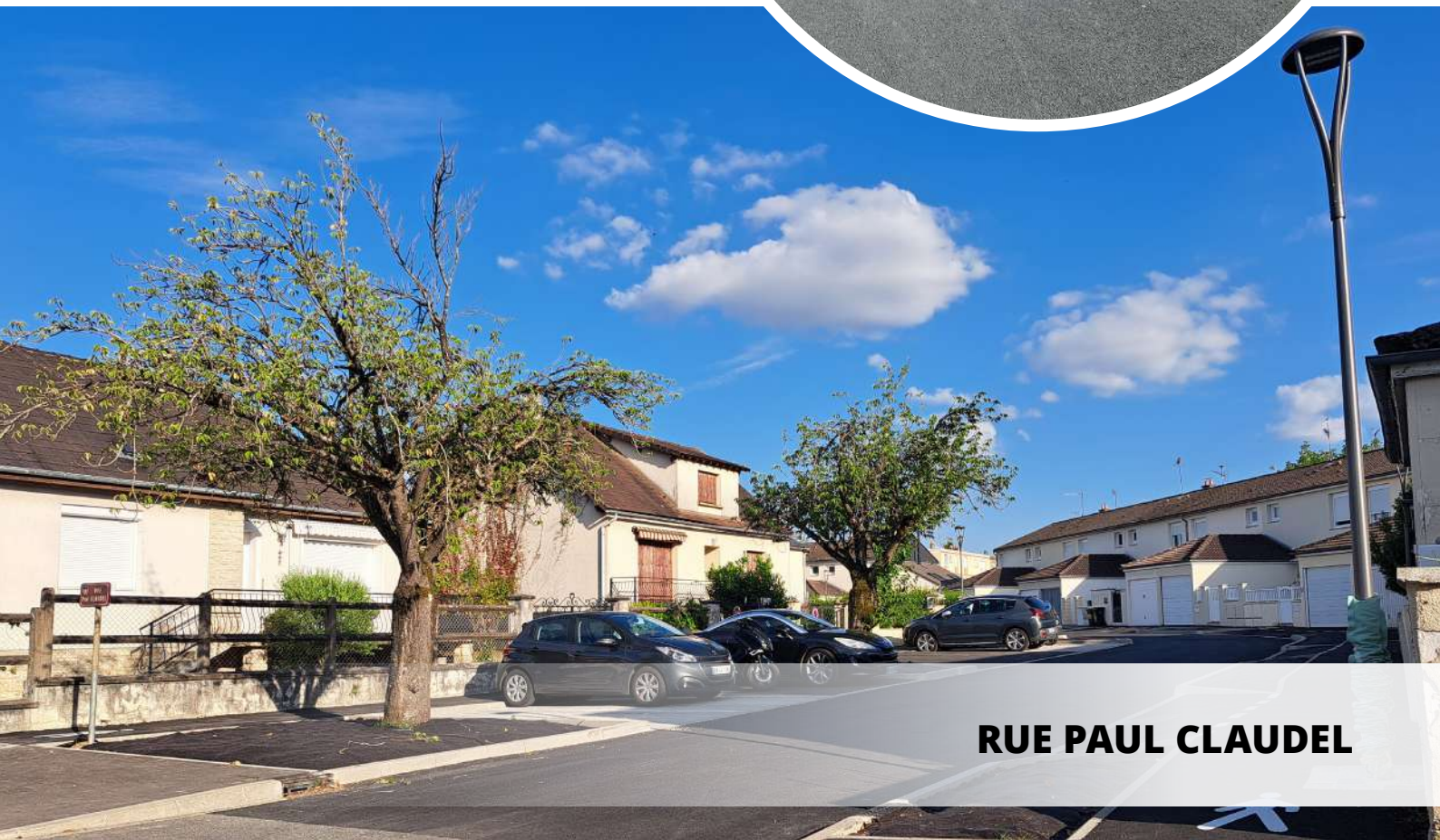
RUE PAUL CLAUDEL