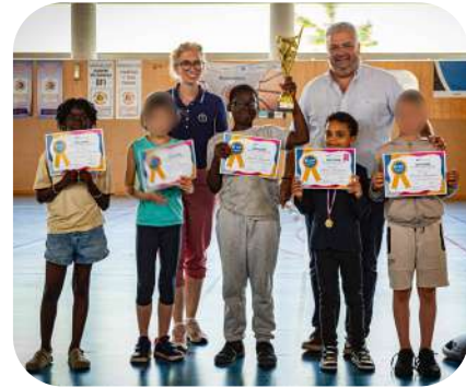
École Jeanne d'Arc classe de CE2