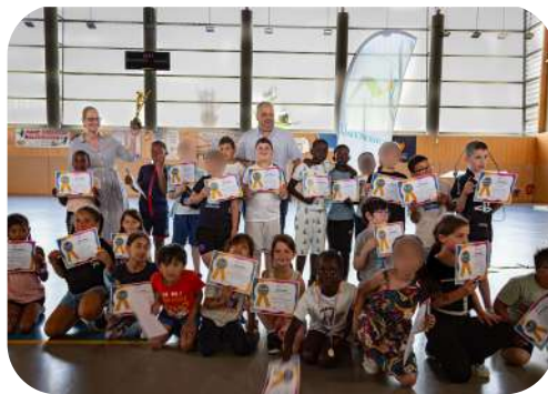
École Mazagran classe de CE1